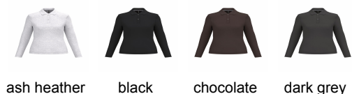
ash heather black chocolate dark grey